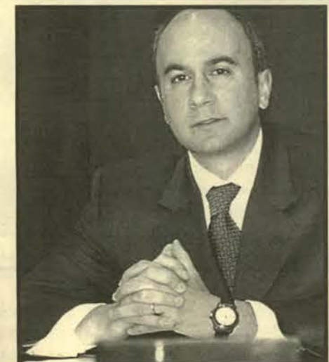
CONCLUSIONES: «Debemos efectuar un balance del año APEC y proyectar la concreción de las tareas propuestas en este foro».