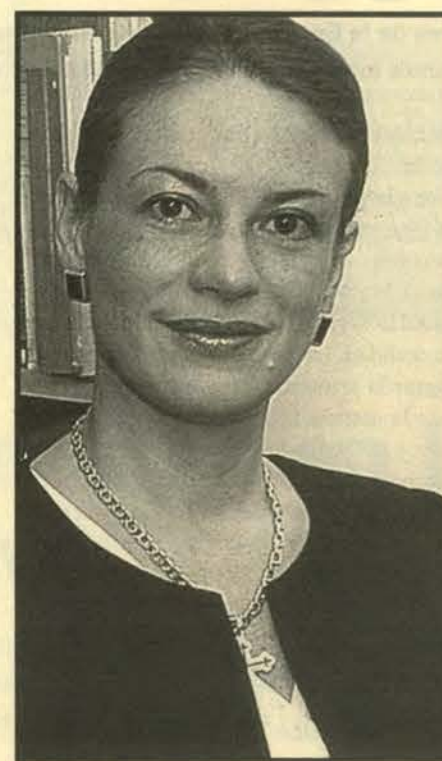
FONDECYT: «Derecho UC ejecuta tres proyectos anuales en el marco de este programa».

—Esta Facultad ha recogido el mensaje del rector, en el sentido de no sólo investigar en nuestra propia área, sino también incursionar en áreas interdisciplinarias. Es así como tenemos profesores en centros de estudio dedicados a la interdisciplina, tales como el centro de bioética de la universidad. Ello implica no sólo una visión jurídica, sino además una visión vinculada a los grandes valores, como la protección a la vida, el resguardo de los derechos de las personas, la defensa de la familia y otros tantos aspectos en que nuestra Facultad demuestra que en ella se busca no sólo dar una solución legal a los problemas, sino también conforme a la ética que debe inspirar toda decisión justa. UC