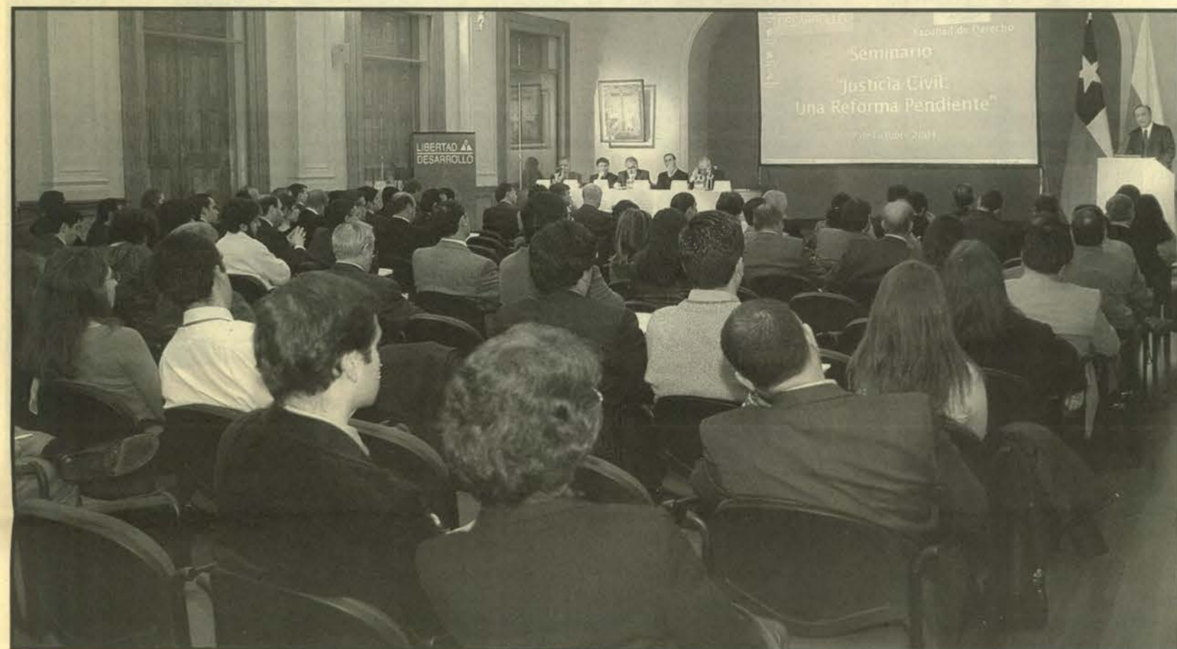
ALTA ASISTENCIA. Una amplia convocatoria caracterizó la realización de este seminario.

El Seminario contó con una gran audiencia, tanto de expertos y académicos, como de alumnos de nuestra Facultad y de otras escuelas de Derecho del país. Una vez más, Derecho UC, un paso adelante. DUC