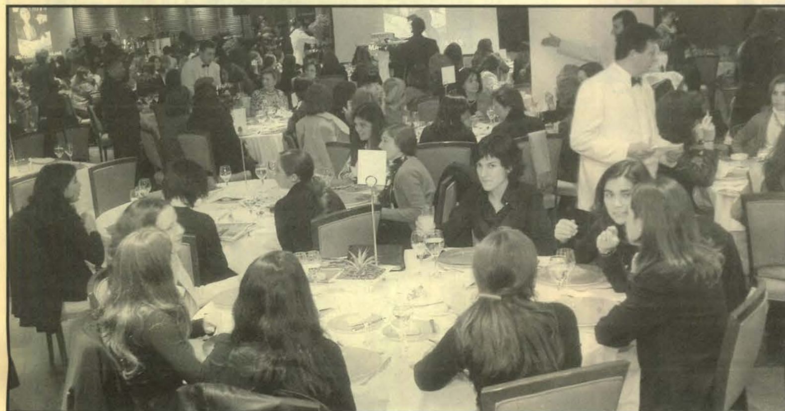
PANORÁMICA: Una perspectiva de aquella jornada femenina, organizada tan exitosamente por el Centro de Ex Alumnos de nuestra Facultad. En esta ocasión se dieron cita más de 300 egresadas de diversas generaciones que pasaron por las aulas de Derecho UC.

Pero este ciclo de actividades no ha concluido. Como planes inmediatos, su directorio está organizando un ciclo de exposiciones de los candidatos presidenciales para agosto y la comida anual 2005, en la que se espera contar con la masiva participación de todos quienes se formaron en nuestro Derecho UC.