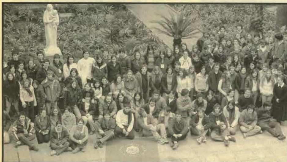
CONVOCATORIA MASIVA: Más de 200 jóvenes acudieron este año al llamado de las Misiones de Invierno. Una panorámica de ellos en el tradicional “patio de la Virgen”.

Convocados por este lema, el sábado 16 de julio —tras una misa presidida por Monseñor Andrés Arteaga en la capilla de la Casa Central— más de 200 jóvenes partieron rumbo al norte, a hacer efectivo su compromiso con Cristo. Compruebe cómo los alumnos de nuestra Facultad están activamente comprometidos con la labor misionera a la que llama en esta época la Iglesia.