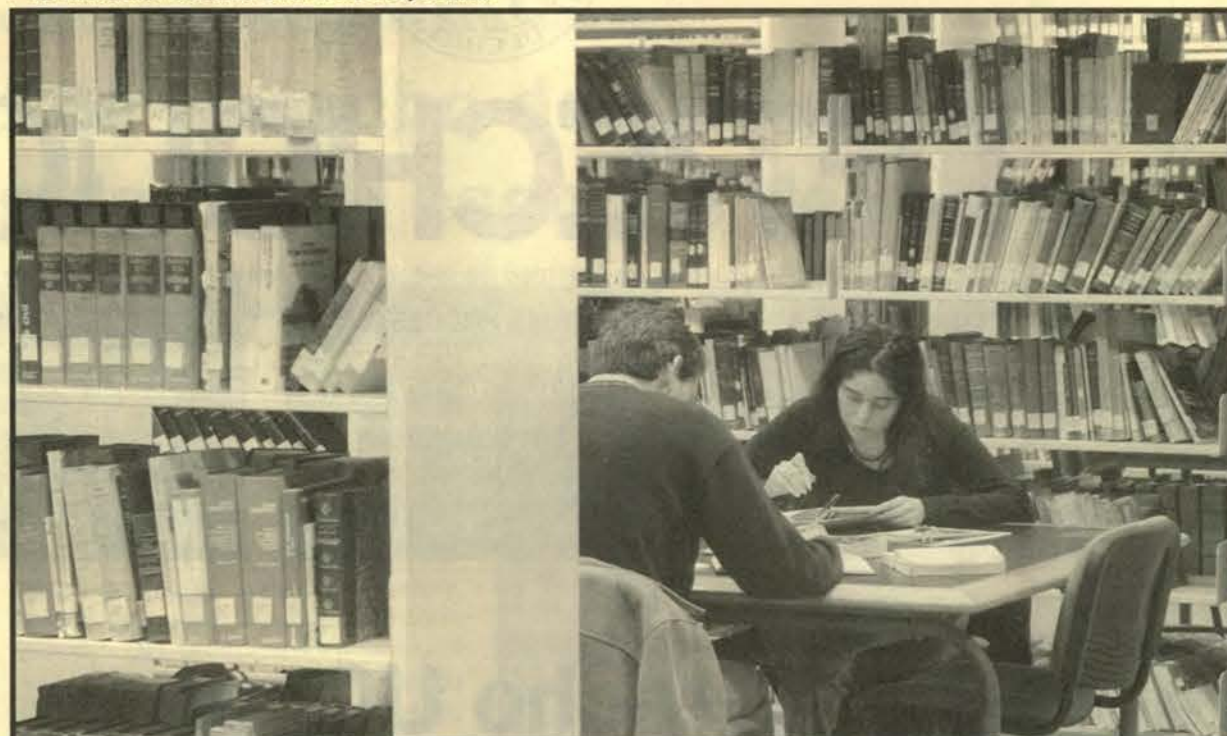
¿ESTUDIO E INVESTIGACIÓN?: Los alumnos de nuestra Facultad estudian y preparan exámenes en la biblioteca, pero deben abrirse a investigar.

► La biblioteca Derecho UC... viene de portada.