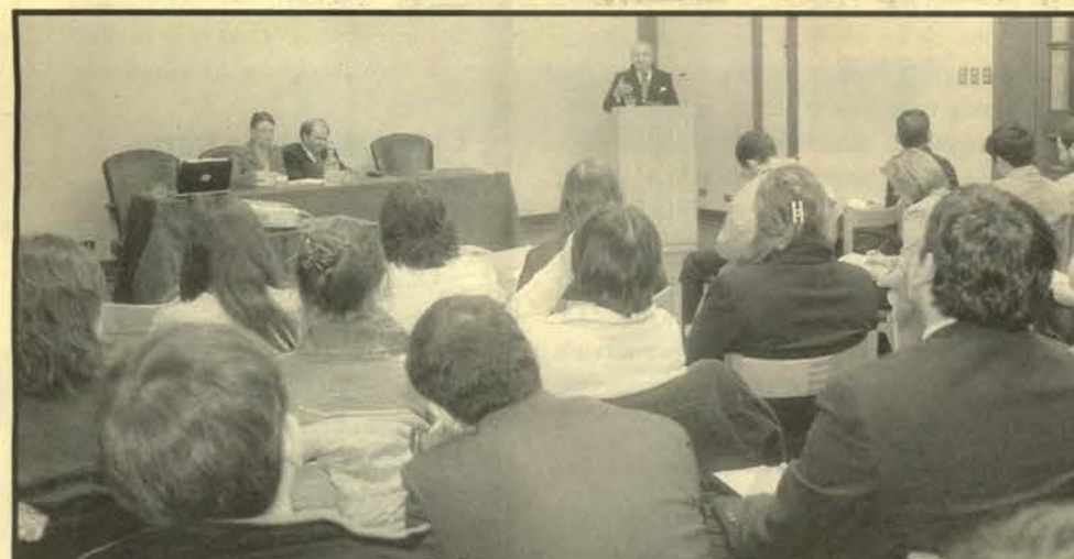
ENCUENTRO: El seminario permitió reunir tanto a alumnos ayudantes como a profesores. En la foto, una perspectiva de esta actividad desarrollada en la sala Pedro Lira.