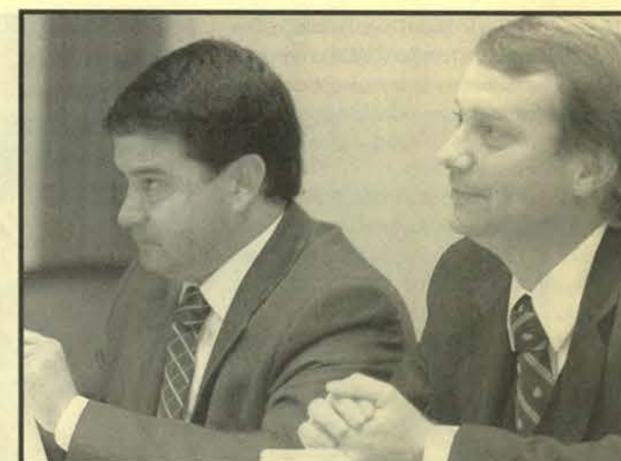
AUTORIDADES: Los diputados Marcelo Forni y José Antonio Kast, este último egresado de las aulas de Derecho UC.